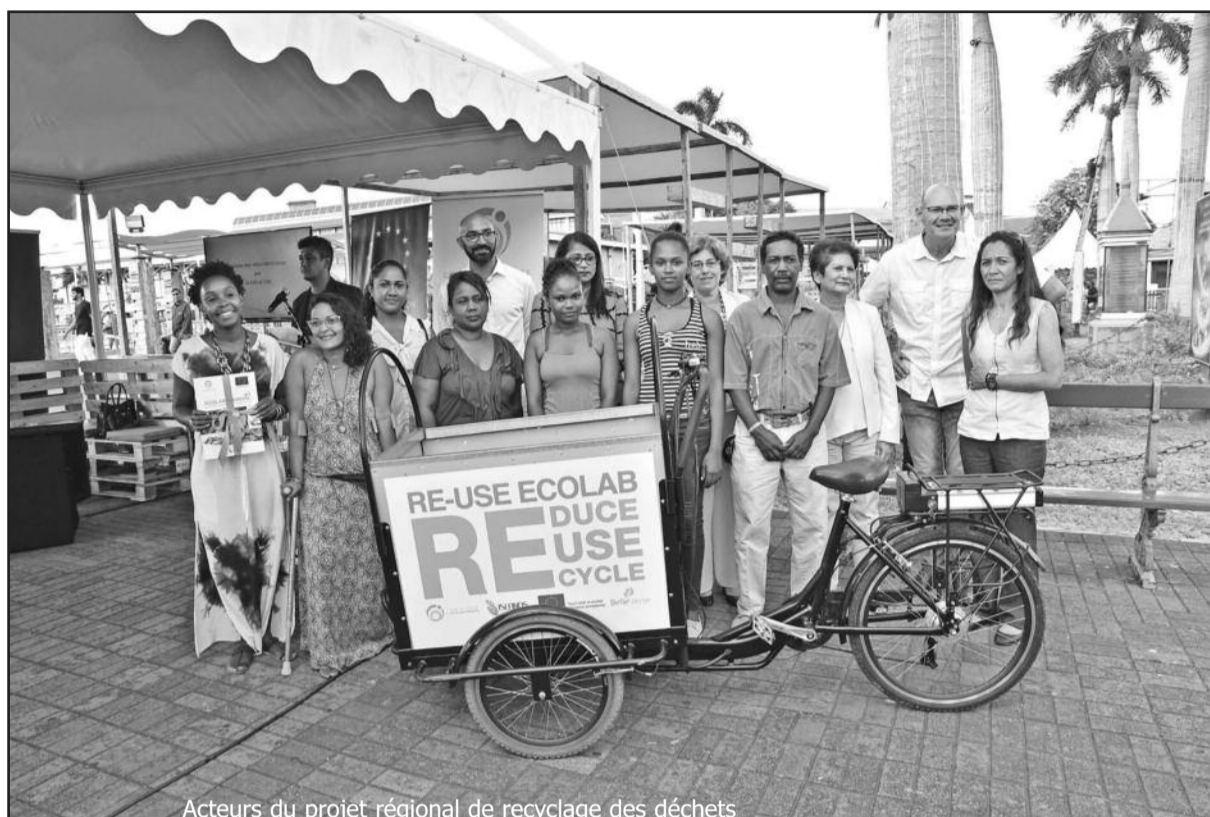
Acteurs du projet régional de recyclage des déchets